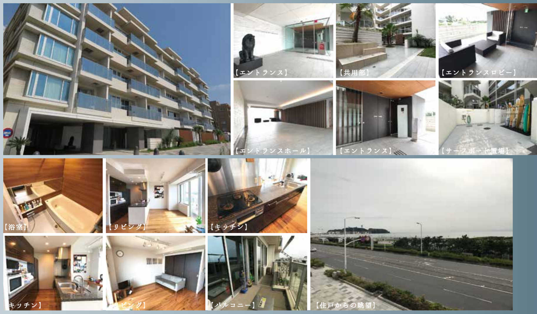
《外観・共用部・室内の様子》